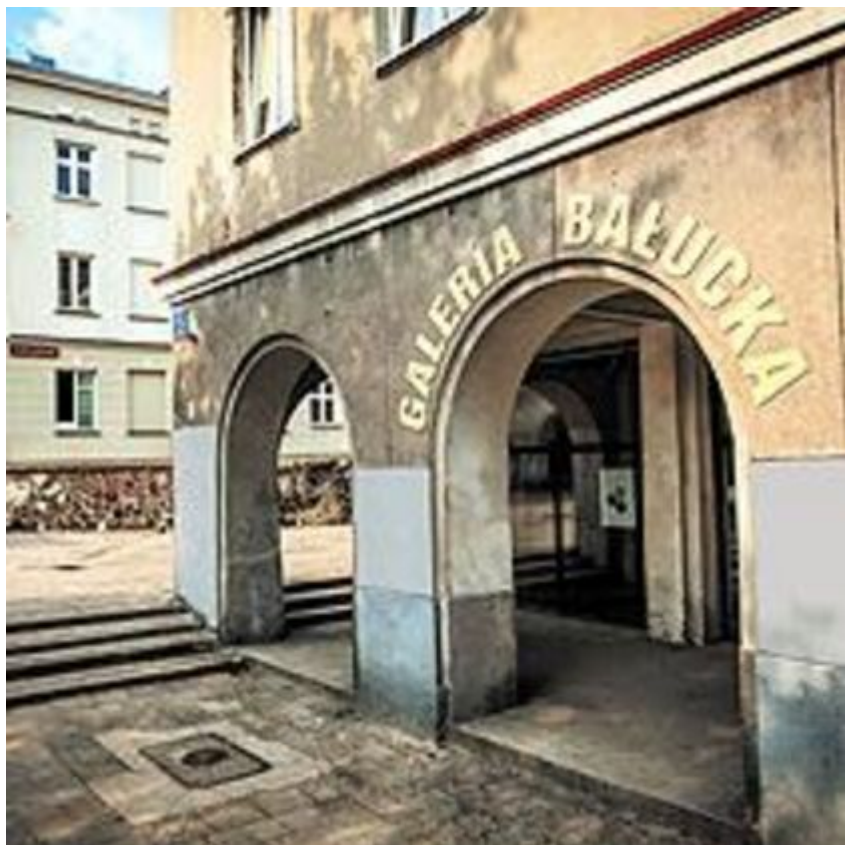
Galeria Bałucka

Miejska Galeria Sztuki - Ośrodek Propagandy Sztuki: