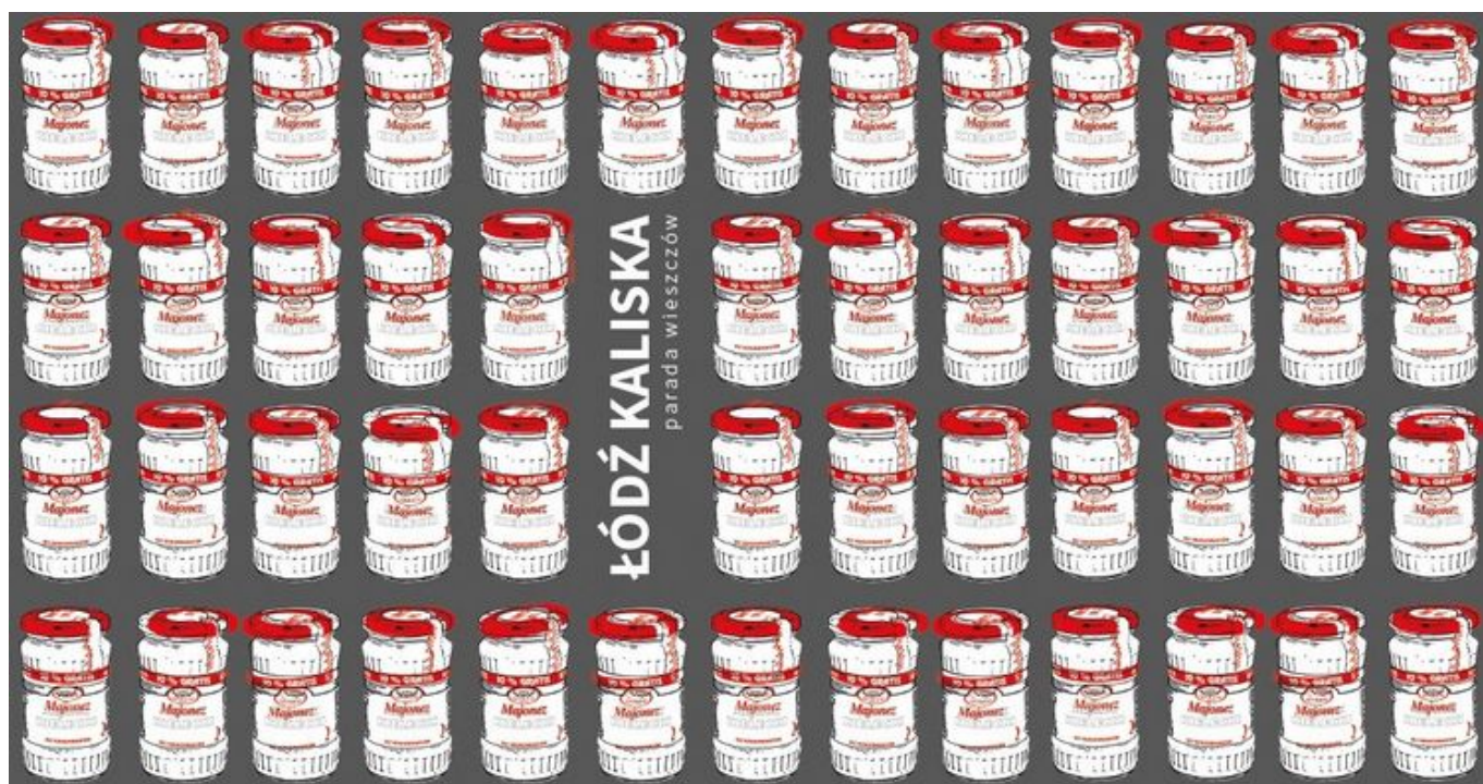
Grafika promująca wydarzenie: Łódź Kaliska Parada Wieszców | wystawa w Ośrodku Propagandy Sztuki (Miejska Galeria Sztuki w Łodzi)

Wystawa towarzyszy programowi tegorocznego Międzynarodowego Festiwalu Fotografii FotoFestiwal, który w tej edycji zorganizowany jest pod hasłem „Super Natural”. Fotografie Kaliskich podane zostają w kontekście ekologii, cywilizacji, upadku „ery człowieka”.