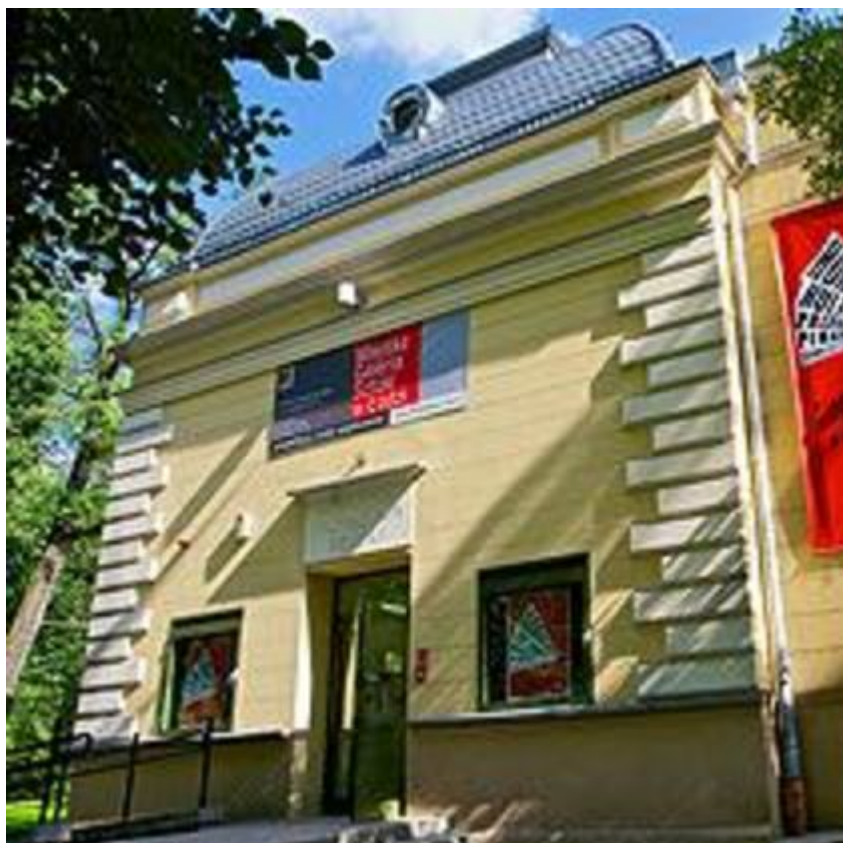
Ośrodek Propagandy Sztuki