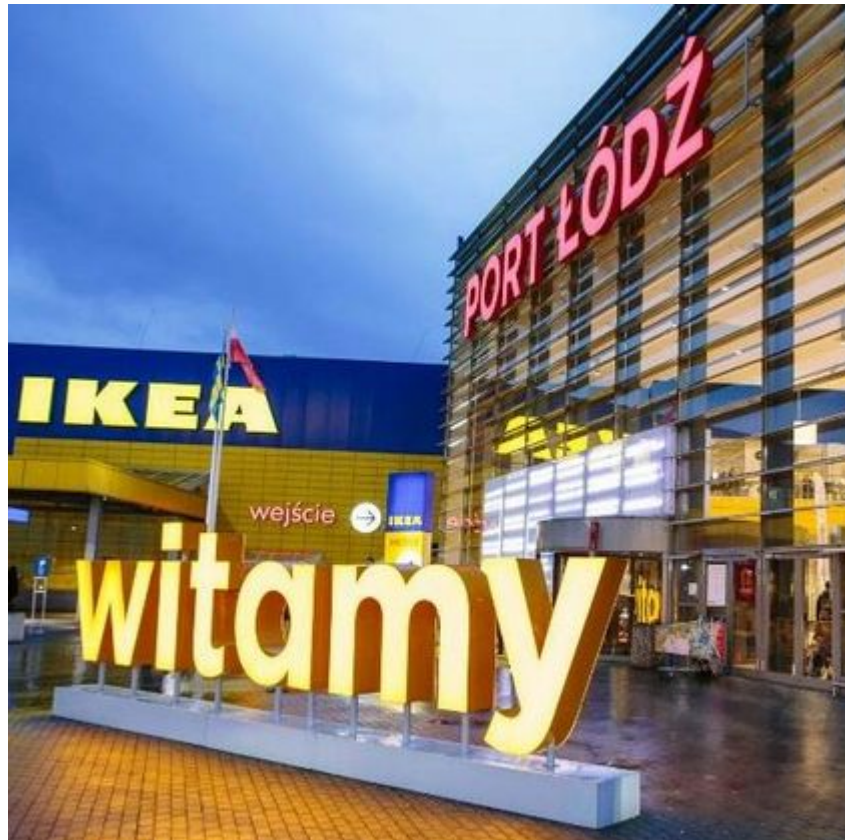
Centrum Handlowe Port Łódź