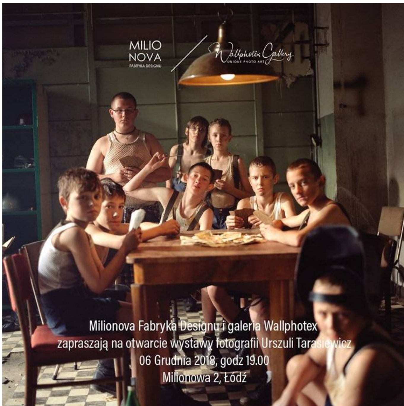
Grafika promująca wydarzenie: "Mikołajki na Milionowej: Wystawa fotografii Urszuli Tarasiewicz w Milionova Fabryka Designu"

W Milionova Fabryka Designu wzornictwo spotyka się ze Sztuką, uzupełniają się i tworzą nowe, ciekawe konteksty. Tego wieczoru w naszym salonie przy ulicy Milionowej 2 zobaczycie Państwo wybór prac artystki dokonany przez Galerię Wallphotex. Są to sekwencję w większych cyklach, przedstawiających motywy zaczerpnięte z okolic Bałt, Ogrodowej, Kaliforni i Norwegii.