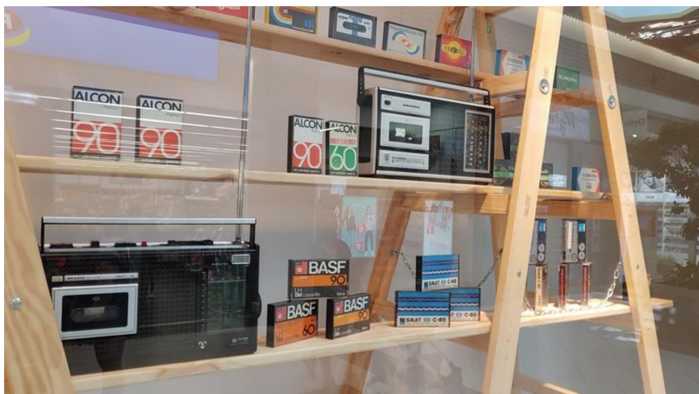
Zdjęcie promujące wydarzenie: Muzyczna podróż do XX wieku - wystawa w Porcie Łódź

Po płytach winylowych nadeszła epoka kaset magnetofonowych, które największą popularnością w Polsce cieszyły się w latach 80 - tych i na początku lat 90 - tych. Mniejsze i umożliwiające słuchanie muzyki na przenośnych urządzeniach typu walkman - podbiły serca audiofilów. W Porcie Łódź ruszyła właśnie bezpłatna wystawa poświęcona tym nośnikom analogowego brzmienia.