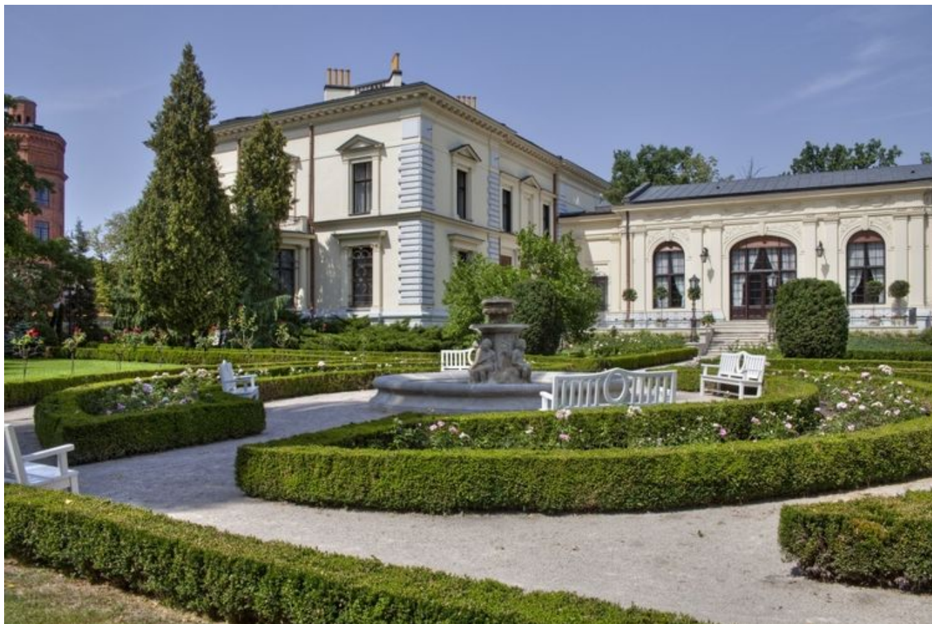
Muzeum Pałac Herbsta, 90-338 Łódź, ul. Przędzalniana 72

Pałac Herbsta to miejsce nierozdzielnie związane z losami rodziny Herbstów i Scheiblerów, zaliczanych do najbogatszych i najbardziej wpływowych rodzin przemysłowców nie tylko w Łodzi, lecz także na całych ziemiach polskich w drugiej połowie XIX wieku. Projekt wystroju pomieszczeń i nowej aranżacji pałacowych wnętrz powstał w oparciu o dokumentację konserwatorską i nieznane wcześniej archiwalne fotografie. Dzięki nowym źródłom informacji wnętrza są teraz bliższe oryginałowi z czasów, gdy mieszkała w nich rodzina Herbstów.