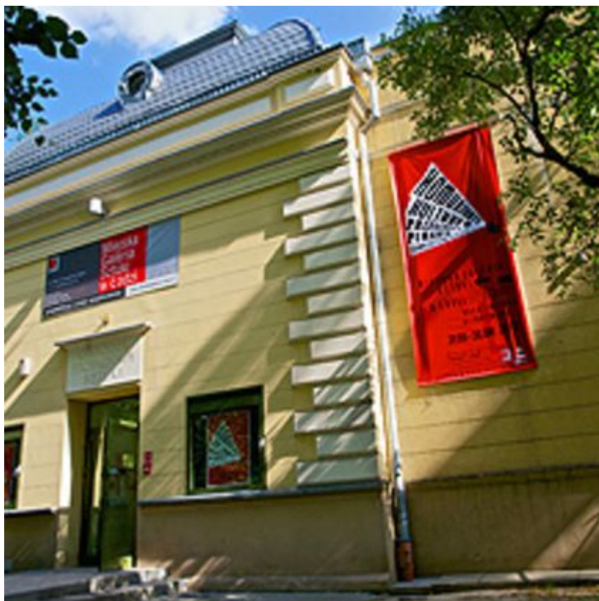
Ośrodek Propagandy Sztuki

Studentka Grafiki w Akademii Sztuk Pięknych im. Władysława Strzemińskiego w Łodzi. Zajmuje się rysunkiem, malarstwem i grafiką. Inspiruje ją miasto Łódź, gdzie żyje i tworzy. Cykl pt. „Myśl”, który stworzyła pod kierunkiem profesora Zbigniewa Nowickiego, został doceniony m.in. w tegorocznym 35. Konkursie im. Władysława Strzemińskiego - Sztuki Piękne.