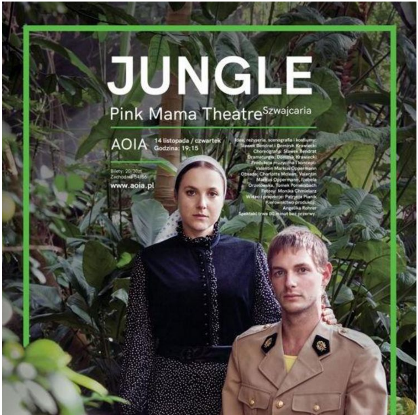
Grafika promująca wydarzenie: Pink Mama Theatre - Szwajcaria „Jungle” | spektakl w AOIA

Łącząc taniec, teatr wraz z narracją dramatyczną Jungle jest surrealistyczną oraz zmysłową opowieścią o czwórce bohaterów dążących do przetrwania. Poszukują oni schronienia w wymyślonym, bliżej nieokreślonym, postkolonialnym świecie, któremu grozi nowy przywódca. Świat ten jest miejscem, gdzie ich działania wpływają oraz zarażają wszystko i wszystkich dookoła.