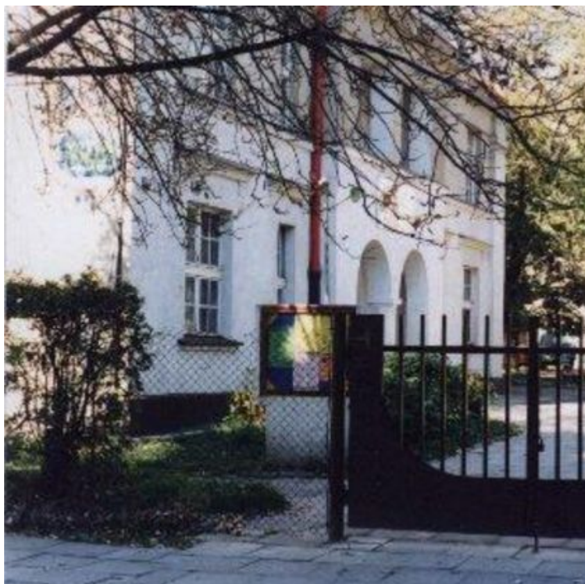
Centrum Kultury Młodych