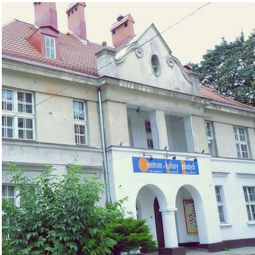
Centrum Kultury Młodych