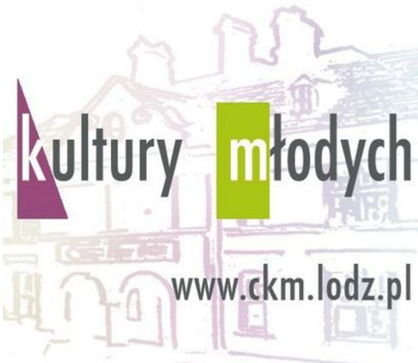
Centrum Kultury Młodych