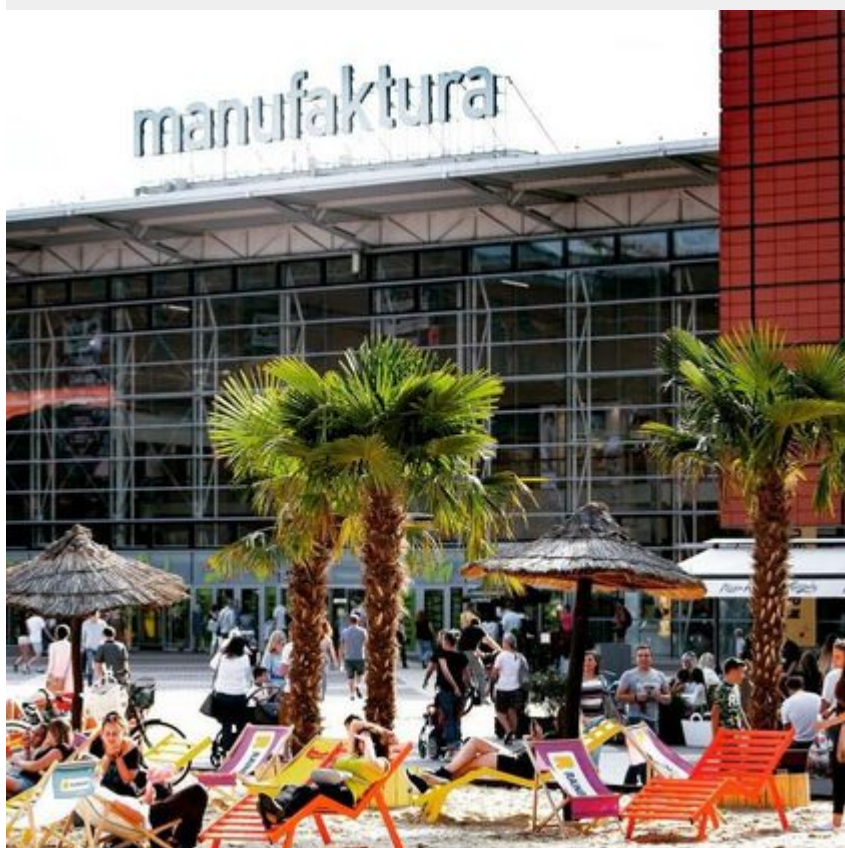
Rynek Manufaktury