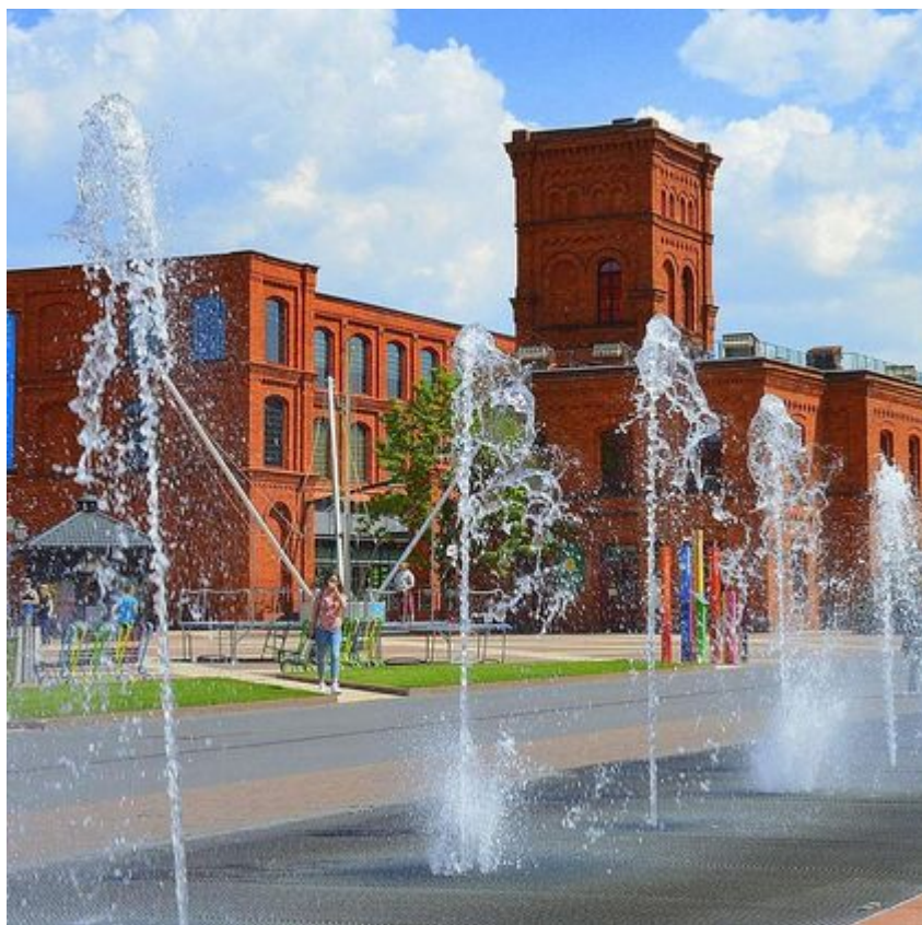
Rynek Manufaktury

W piątek i w sobotę zaplanowano imprezy z DJ-em, podczas których uczestnicy bawić się będą przy najpopularniejszych hitach tego roku.