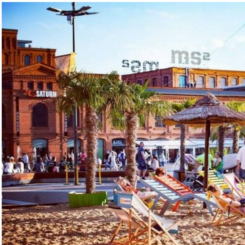
Rynek Manufaktury