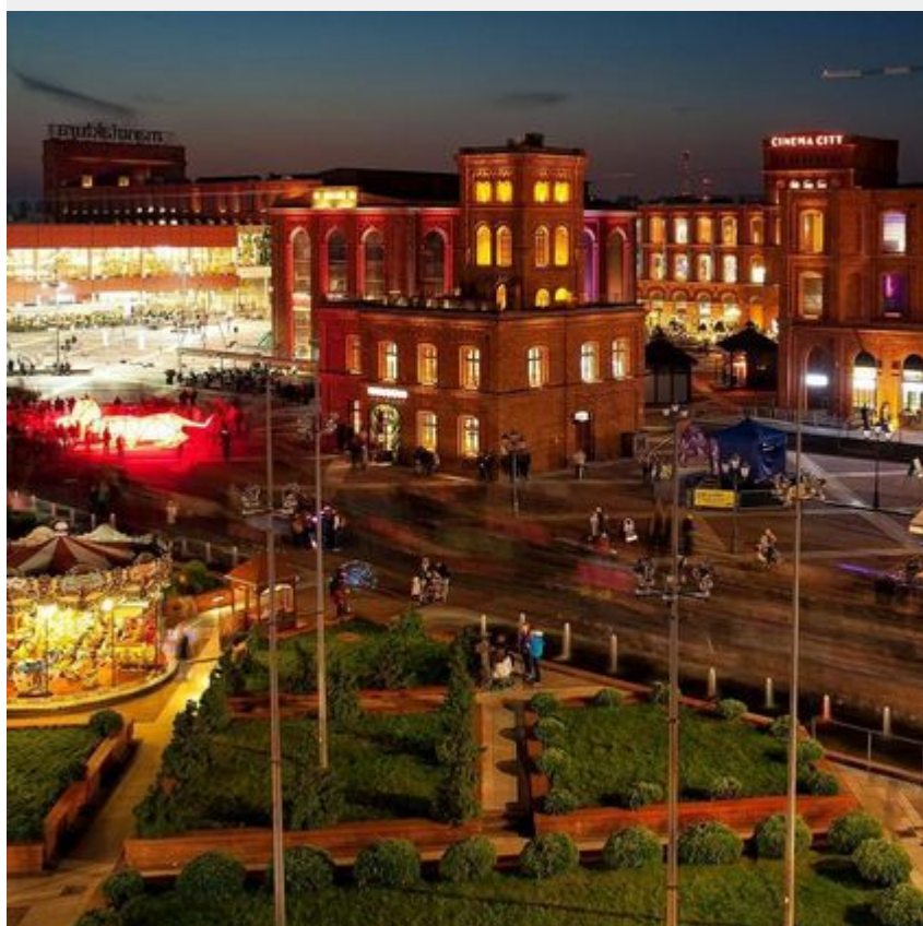
Rynek Manufaktury