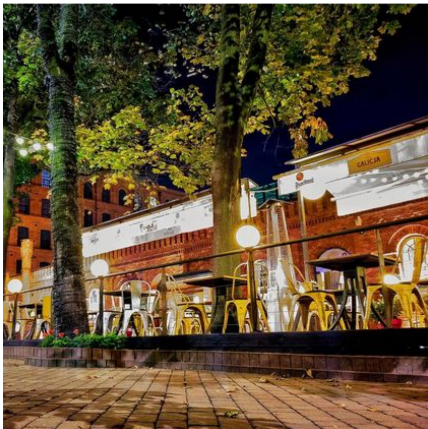
Rynek Manufaktury

Manufaktura jeden z najbardziej rozpoznawalnych symboli Łodzi. Dzięki niej zabytkowe fabryki zostały przywrócone miastu, a na rynku dawnego imperium Izraela Poznańskiego znów zatętniło życie. Manufaktura to: muzea, kino, teatr, ćwierć tysiąca butików i sklepów, place zabaw dla najmłodszych, klub fitness, kilkadziesiąt restauracji i kawiarni. Jednak jej punktem centralnym jest ponad trzyhektarowy Rynek Włókniaerek Łódzkich, pełniący funkcję przyjaznej przestrzeni publicznej. To tutaj organizowane są imprezy kulturalne i rozrywkowe, przyciągające zarówno łodzian, jaki i turystów.