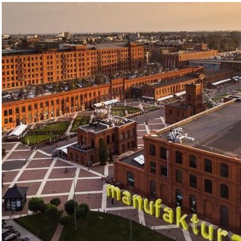
Rynek Manufaktury