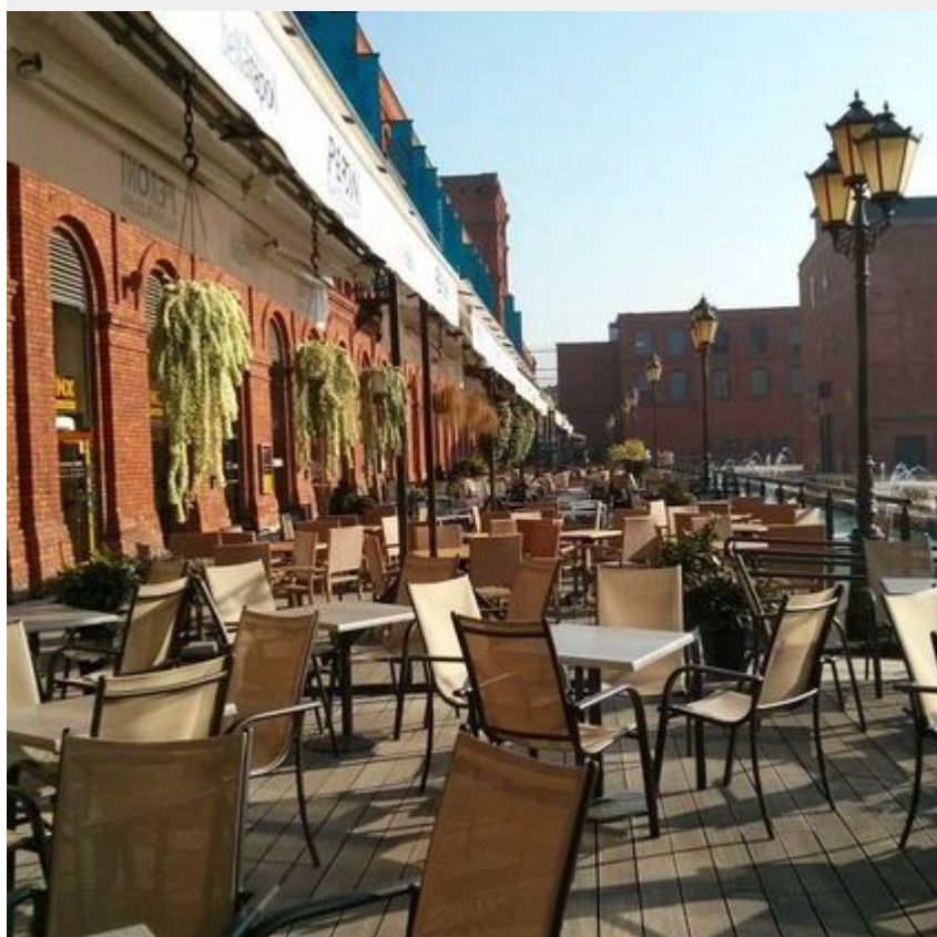
Rynek Manufaktury