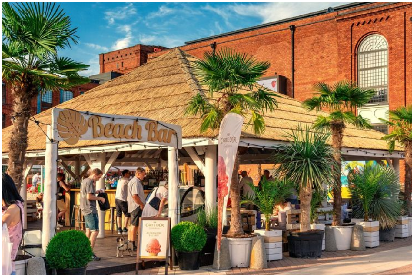
Zdjęcie promujące wydarzenie: Pożegnanie Beach Baru w Manufakturze

W sobotę (14.09) wszyscy miłośnicy imprez pod palmami będą mieli ostatnią okazję w tym roku, by bawić się w beach barze. Ulubiony letni klub pod gołym niebem wróci na rynek Manufakturze w czerwcu przyszłego roku.