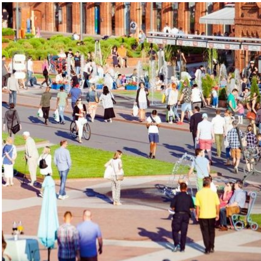
Rynek Manufaktury, fot. mat. Manufaktura