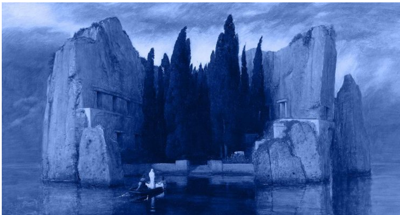
Zdjęcie promujące wydarzenie: "Śmierć mózgowa - kontrowersje i obrazy filmowe" - wykład w MS2 Arnold Böcklin, Die Toteninsel III, Alte Nationalgalerie, Berlin

W ramach cyklu otwartych wykładów/seminariów: "Początek i koniec życia - aspekty etyczne i ich audiowizualne reprezentacje". Audiowizualne egzemplifikacje dylematów, z którymi medycyna i bioetyka zmagają się na płaszczyźnie teoretycznej i praktycznej.