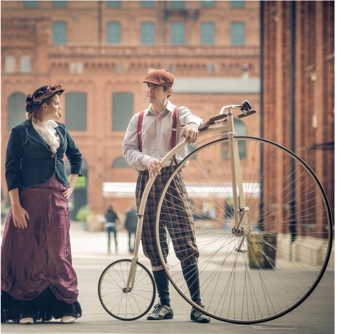
Zdjęcie promujące wydarzenie: SpacerY architektoniczne śladami Izraela Poznańskiego w Manufakturze

SpacerY organizowane są przez Muzeum Fabryki – przewodnicy w strojach z epoki, nie tylko oprowadzają po terenie dawnego imperium Izraela Poznańskiego, ale także zdradzają sekrety obiektu i przytaczają anegdoty, które można poznać tylko tutaj. Co się tu działo, gdy nie było Manufaktury? Kto ponad sto lat temu urzędował w budynku, w którym teraz mieści się Starbucks? Co kiedyś znajdowało się na dachu dzisiejszego hotelu andel's? Podczas wycieczki można dokładnie obejrzyć zabytkową zabudowę i dowiedzieć się, jakie funkcje pełniły w dziewiętnastym wieku budynki, w których dziś mieszczą się sklepy i restauracje.