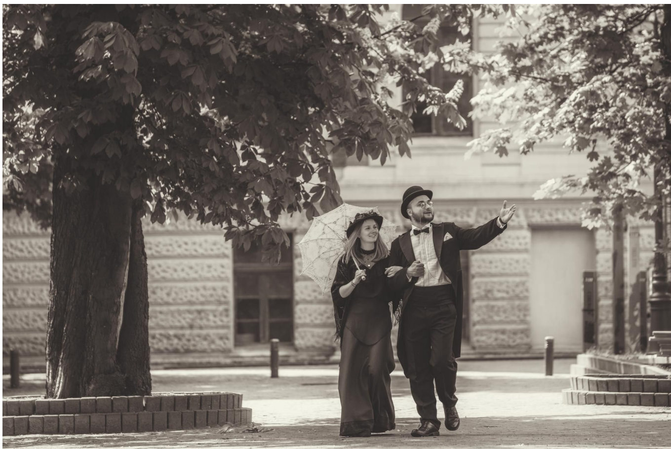
Zdjęcie promujące wydarzenie: SpacerLove | SpacerY architektoniczne śladami Izraela Poznańskiego w Manufakturze

Dziś Manufaktura, kiedyś wielka fabryka zbudowana przez Izraela Poznańskiego, która słynęła z produkcji milionów metrów tkanin bawełnianych. Jeżeli chcecie poznać losy zakładów, to wszystkiego dowiedziecie się od wykwalifikowanych przewodników z Muzeum Fabryki. Podczas zwiedzania przejdziecie pod słynną bramą wejściową do zakładów - bohaterką wielu znanych ujęć filmowych. Poznacie też dawne funkcje wszystkich budynków na terenie kompleksu oraz jak zmieniły się na przestrzeni lat.