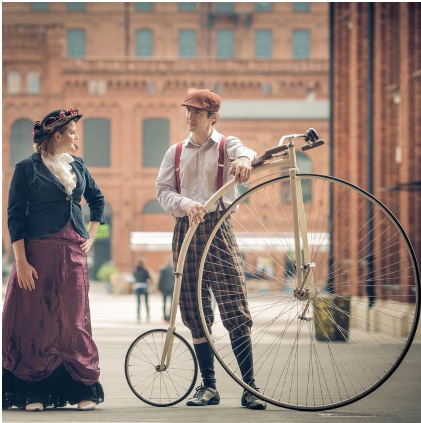
Zdjęcie promujące wydarzenie: SpacerY architektoniczne śladami Izraela Poznańskiego w Manufakturze

SpacerY organizowane są przez Muzeum Fabryki – przewodnicy w strojach z epoki, nie tylko oprowadzają po terenie dawnego imperium Izraela Poznańskiego, ale także zdradzają sekrety obiektu i przytaczają anegdoty, które można poznać tylko tutaj. Co się tu działo, gdy nie było Manufaktury? Kto ponad sto lat temu urzędował w budynku, w którym teraz mieści się Starbucks? Co kiedyś znajdowało się na dachu dzisiejszego hotelu andel's? Podczas wycieczki można dokładnie obejrzeć zabytkową zabudowę i dowiedzieć się, jakie funkcje pełniły w dziewiętnastym wieku budynki, w których dziś mieszczą się sklepy i restauracje.