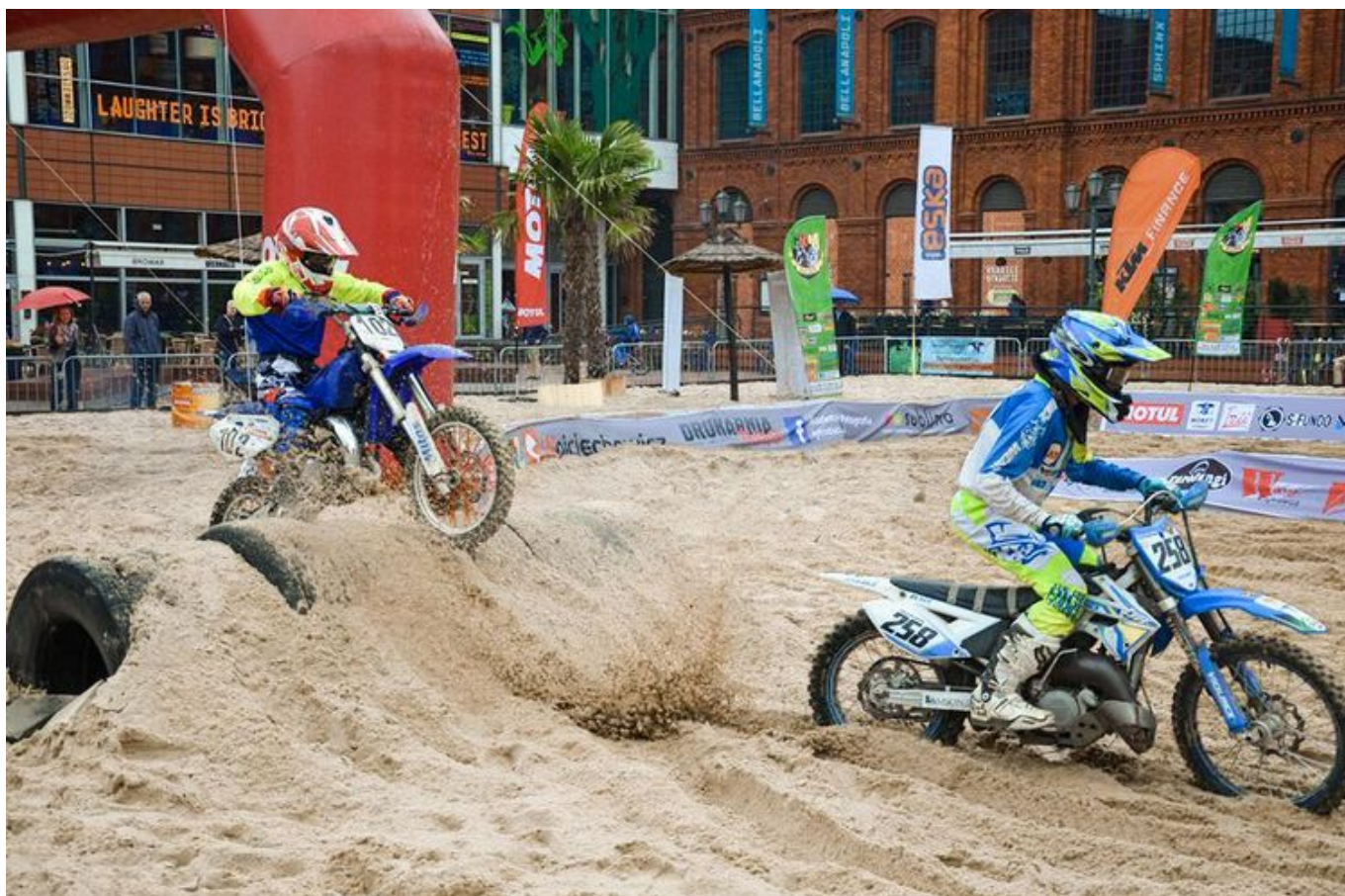
Zdjęcie promujące wydarzenie: Super Enduro - Na motocyklu po plaży | zawody w Manufakturze

O godz. 13:00 na plażę w Manufakturze wjadą pierwsi zawodnicy ścigający się w parach (head to head). Będą mieli do pokonania pięć przeszkód ułożonych m.in. z opon i belek drewna – liczyć się będzie nie tylko szybkość, ale i spryt! Zawodnicy wystartują w 5 kategoriach: młodzik, kobiety, open, 40+ i amatorzy. Najmłodszy zawodnik będzie miał 12 lat, a najmłodsza zawodniczka – 13.