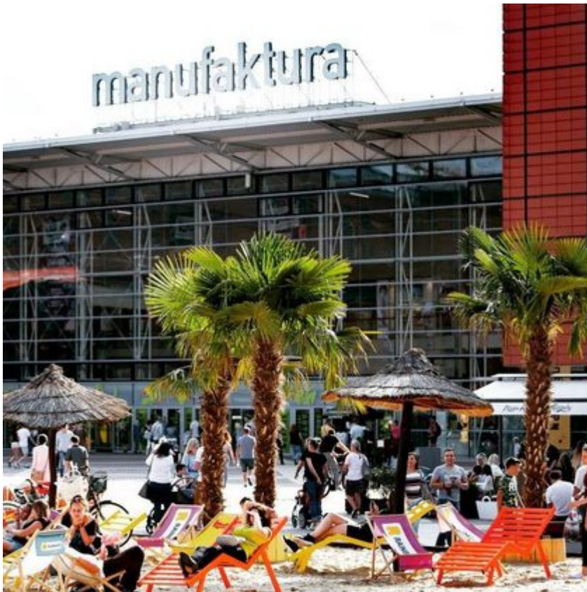
Rynek Manufaktury