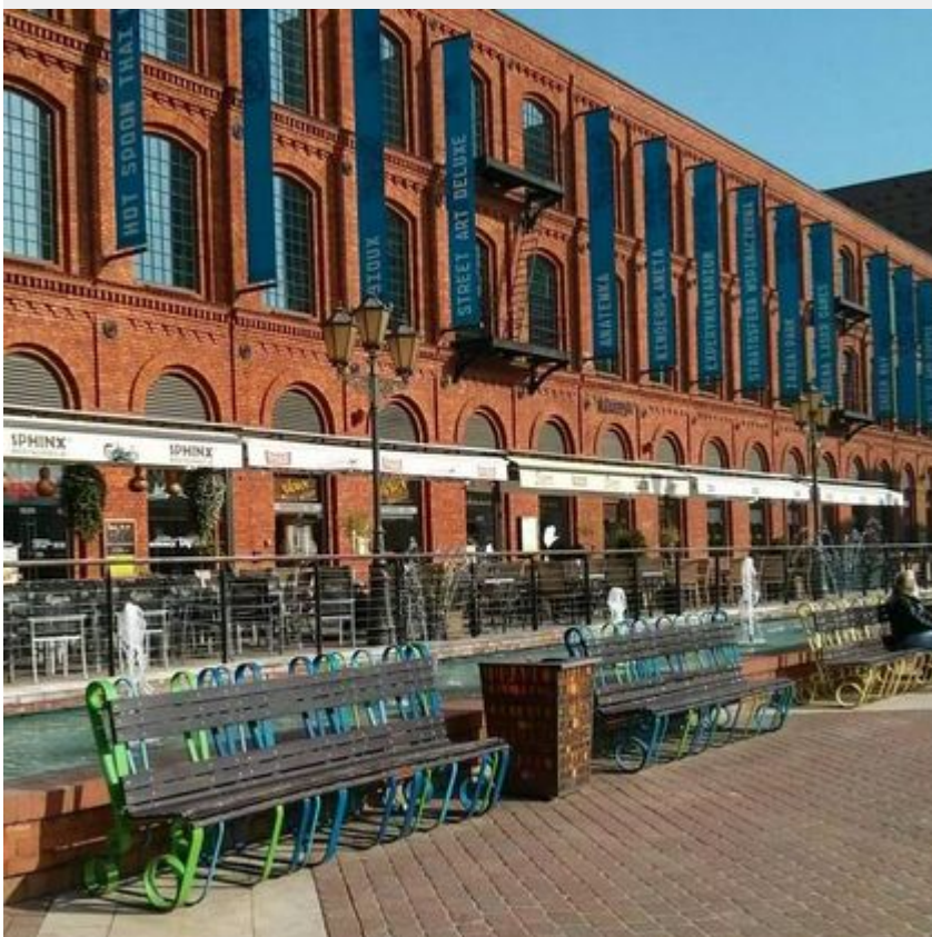
Rynek Manufaktury