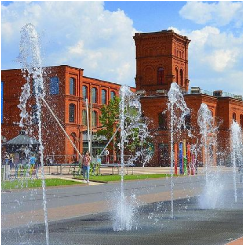
Rynek Manufaktury