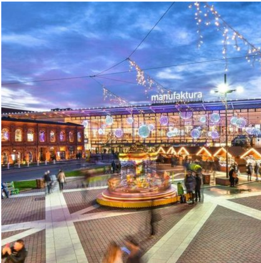
Rynek Manufaktury