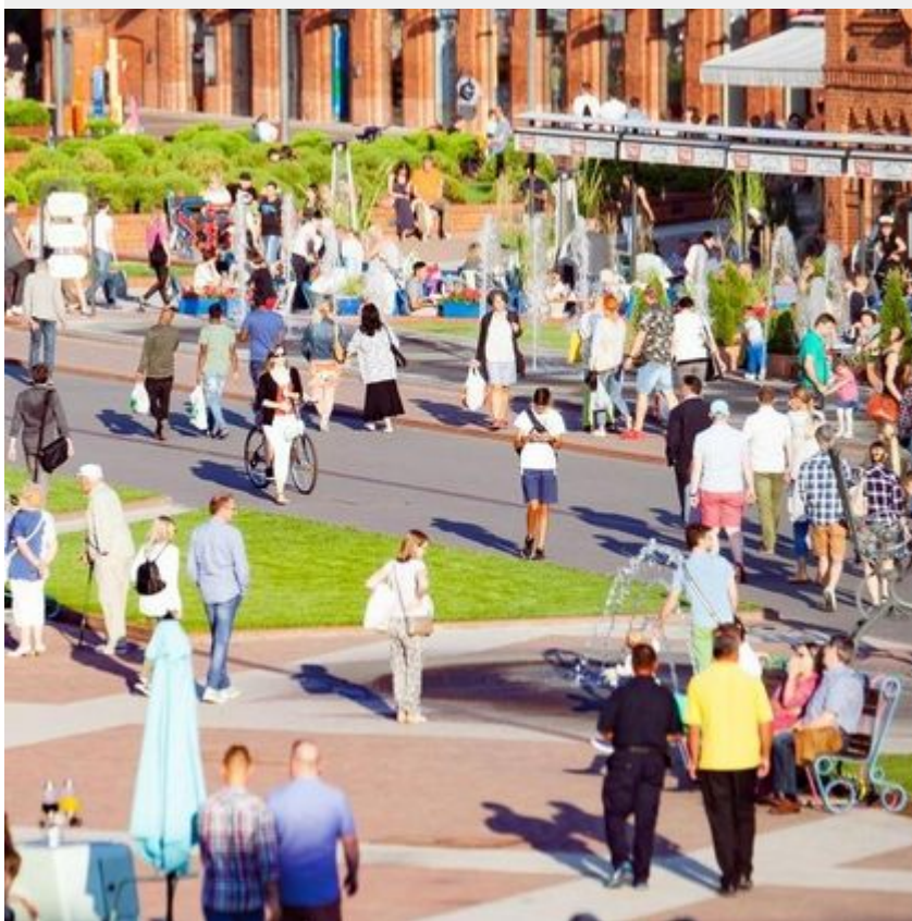
Rynek Manufaktury