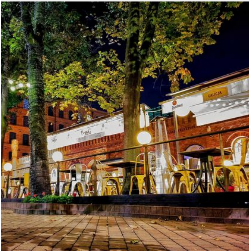
Rynek Manufaktury