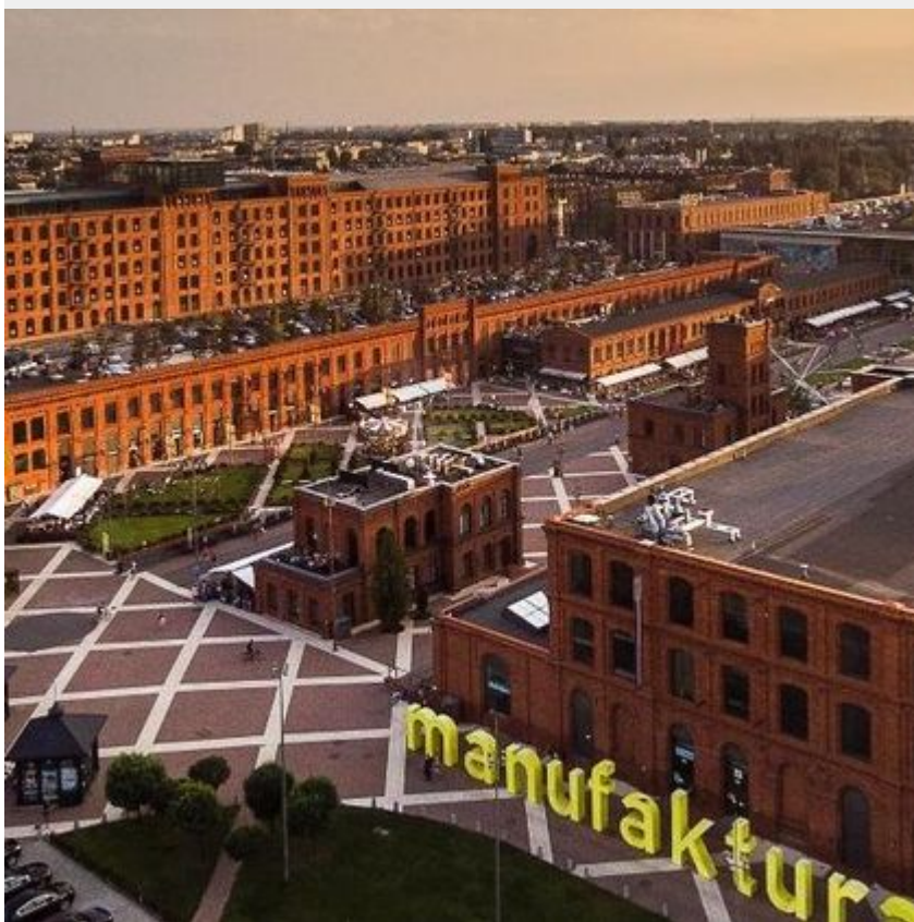
Rynek Manufaktury