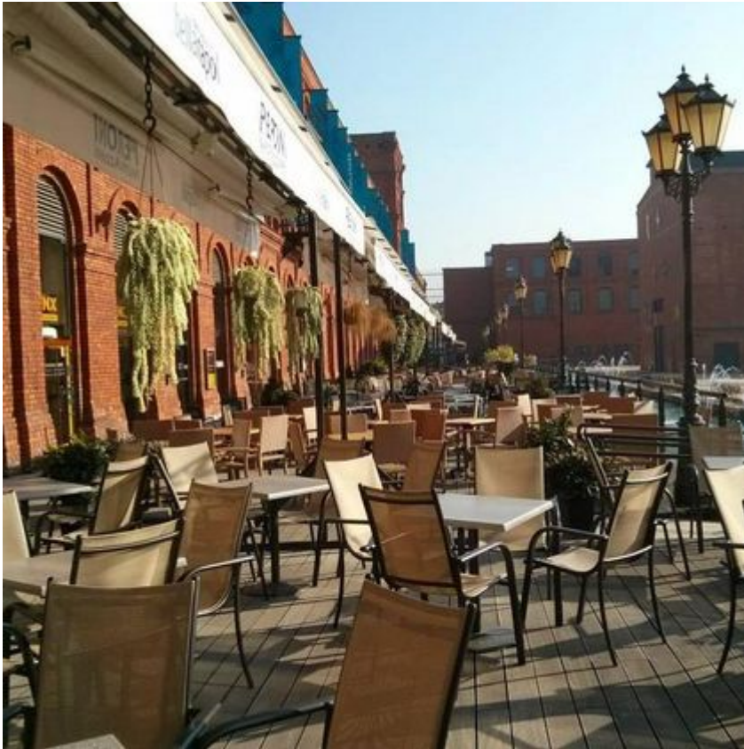
Rynek Manufaktury