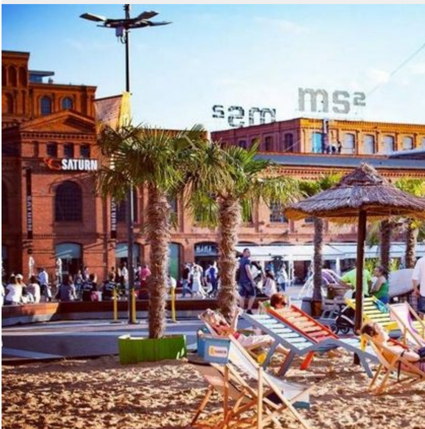
Rynek Manufaktury