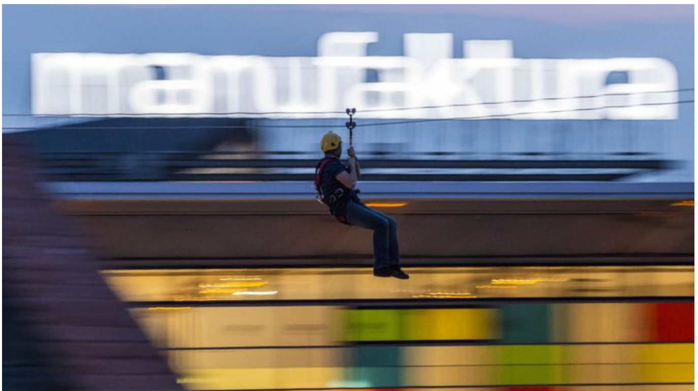
Zdjęcie promujące wydarzenie: Tyrolka w Manufakturze

Do Manufaktury wróciła atrakcja dla tych, którzy uwielbiają zastrzyk adrenaliny. Wszyscy fani tyrolki znów mogą podziwiać rynek Manufaktury i okolice z wysokości 15 metrów podczas zjazdu na linie. W tym roku nowość - powstała specjalna, nowa droga do tyrolki - wystarczy wjechać windą na drugie piętro i nową klatką schodową wejść bezpośrednio na taras z którego odbywają się zjazdy.