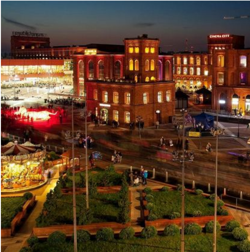
Rynek Manufaktury