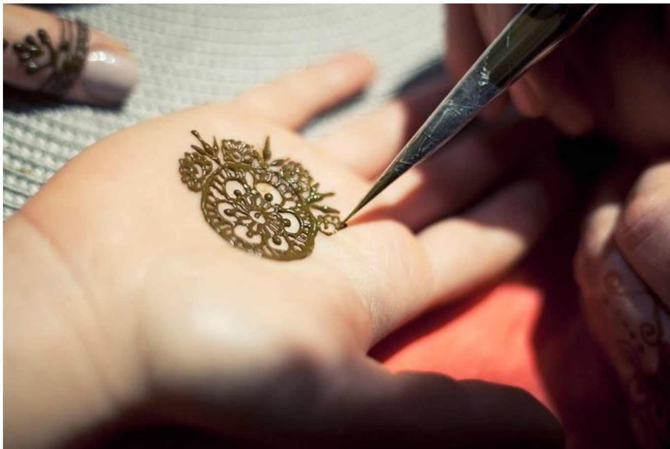
Zdjęcie promujące wydarzenie: "Warsztat Mehendi - malowanie henną"