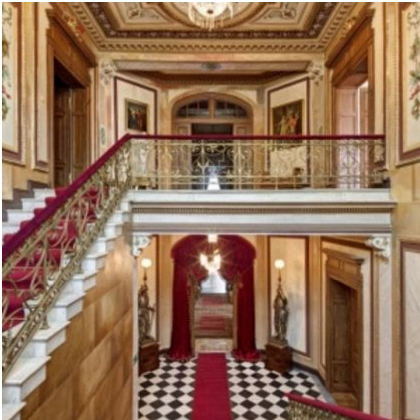
Muzeum Pałac Herbsta