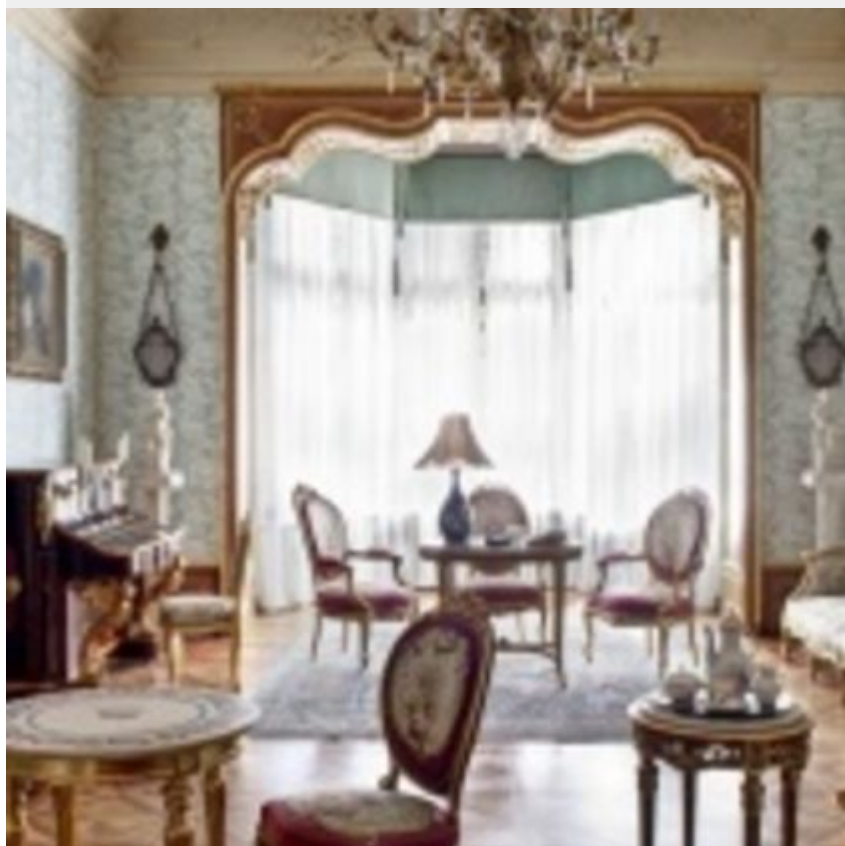
Muzeum Pałac Herbsta