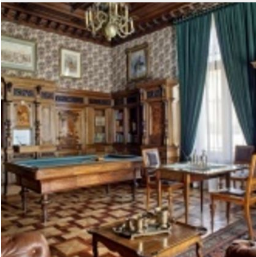
Muzeum Pałac Herbsta