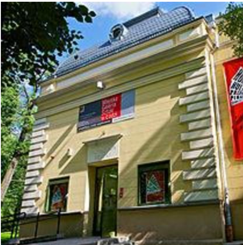
Ośrodek Propagandy Sztuki