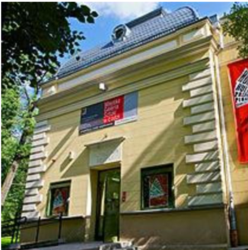
Ośrodek Propagandy Sztuki