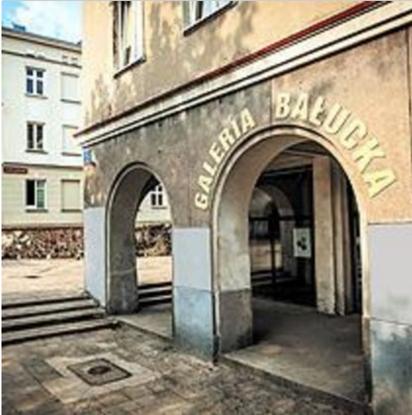
Galeria Bałucka

Miejska Galeria Sztuki w Łodzi - Galeria Willa/ Chimera