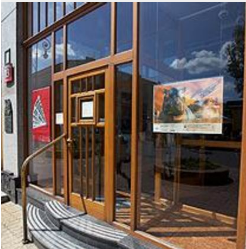
Galeria Re:Medium