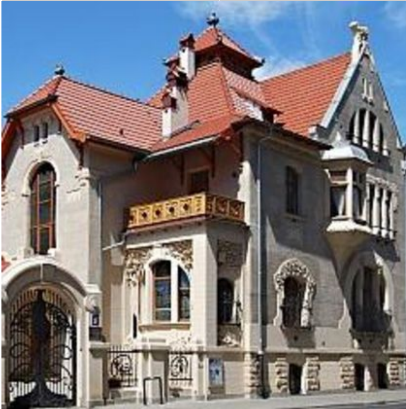
Galeria Willa/ Galeria Chimera, fot. MGSŁ