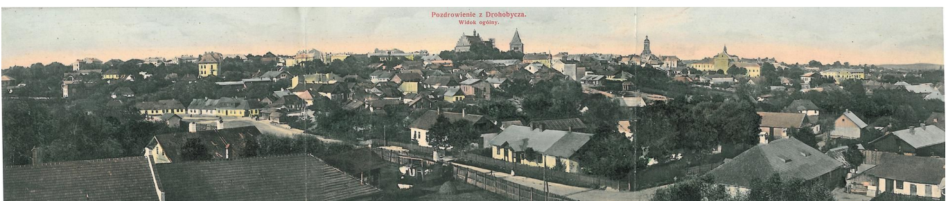
Najdłuższa panorama Drohobycza, Wydawnictwo Kart Widokowych Księgarni J. Pilpla w Drohobyczu, ok. 1910