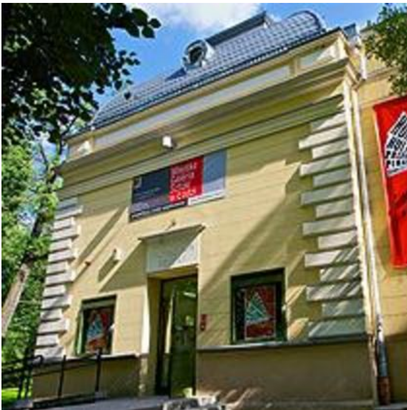
Ośrodek Propagandy Sztuki