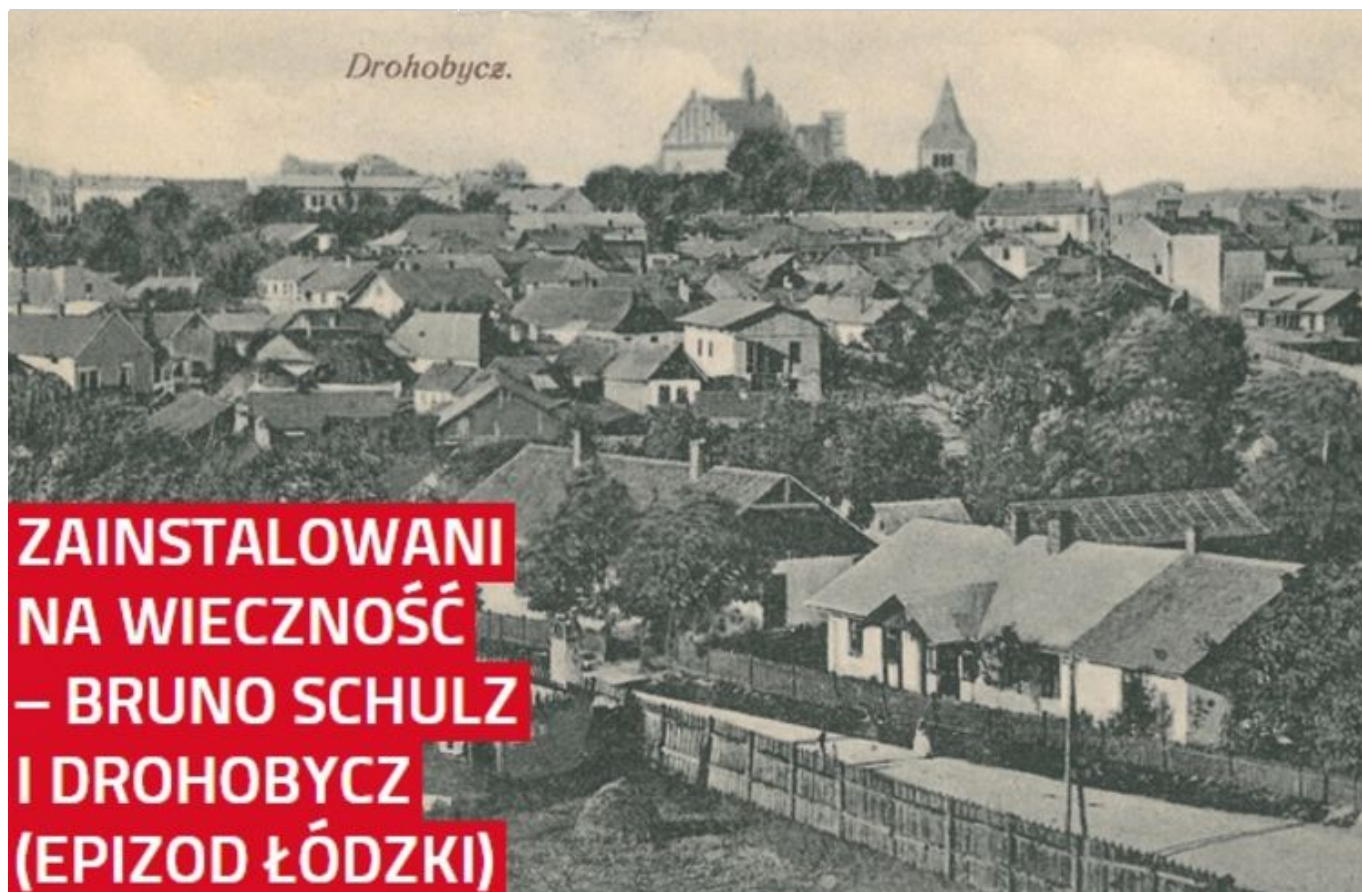
Grafika promująca wydarzenie: "Zainstalowani na wieczność - Bruno Schultz i Drohobycz (Epizod łódzki)" | wystawa w Galerii Willa (Miejska Galeria Sztuki w Łodzi)