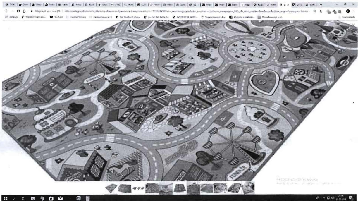
Wykładzina bajkowe miasteczko